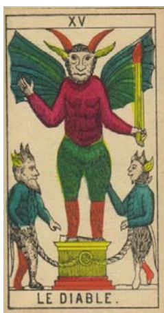
Arcano XV – El Diablo

El diablo muestra a una criatura demoníaca, con cuernos y alas de murciélago, con garras, patas de cabra y una espada puesta sobre un pedestal, del cual salen cadenas que tiene apresados a dos pequeños diablillos, uno masculino y otro femenino.