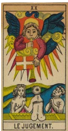
Arcano XX – El Juicio

En el Arcano del Juicio se puede ver al Arcángel Gabriel tocando su trompeta para convocar a vivos y a muertos para el juicio final.