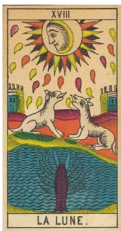
Arcano XVIII – La luna

Este arcano alude a las profundidades de la mente inconsciente, y habla de las traiciones, los enemigos ocultos y de toda clase de tragedias y males que se urden en la clandestinidad.