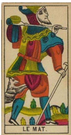
Arcano 0 - El Loco

El loco muestra una figura que anda errante por el mundo, pareciera que un perro le rasga sus vestiduras y él sigue caminado. El loco está vestido como un bufón medieval.