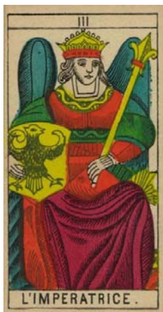
Arcano III – La Emperatriz

La emperatriz muestra a una mujer, coronada, con un cetro muy largo y un escudo de águila. Es la gran madre del Tarot, y simboliza el incremento de la energía femenina en su rol de procreadora fértil. En términos generales la emperatriz representa un Arcano femenino y maternal. Con una inteligencia limpia y práctica como la del Mago, pero mucho más culta y con más recursos, debido a que es una evolución de la sacerdotisa.