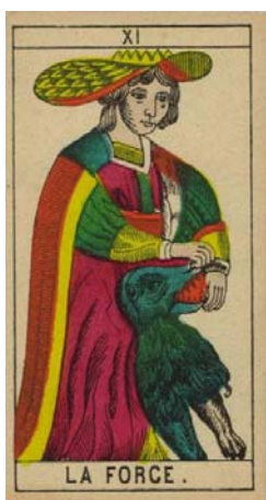
Arcano XI – La fuerza

En el Arcano XI, encontramos a una mujer que se encuentra de pie, abriéndole la boca —o cerrándose— de un león.