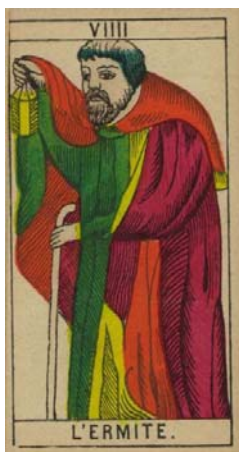
Arcano IX – El ermitaño

El ermitaño muestra a un hombre mayor, un anciano, un tanto encorvado que anda con una linterna alzada, cubierta con su manto, y apoyado en un bastón.