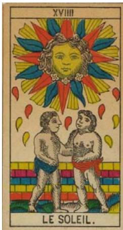
Arcano XIX – El Sol

En el Arcano del Sol aparece un sol con un rostro, brillando y esparciendo luz, sobre dos niños. Los niños son bañados por la luz del sol.