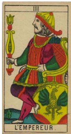
Arcano IV – El emperador

El emperador muestra a un hombre mayor con barba blanca, que sostiene un cetro y parece estar con las piernas cruzadas como haciendo un cuatro, a sus pies está un escudo.