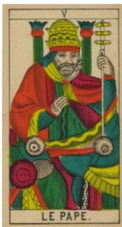
Arcano V – El hierofante

En esta carta nos encontramos a un papa, a un sumo sacerdote, está sosteniendo su báculo, símbolo de su sacerdocio, y aconseja a dos personas que parecen estar a sus pies buscando su ayuda.