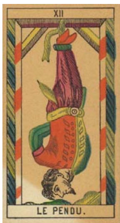
Arcano XII – El colgado

El colgado muestra la imagen de una persona que se encuentra en una especie de marco, colgado de los pies, con la cabeza hacia abajo, y con las manos posiblemente atadas a la espalda.