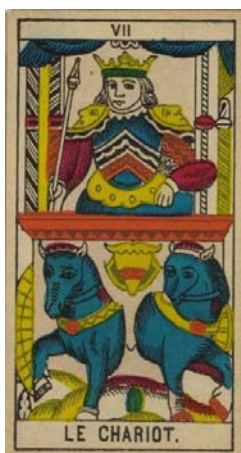
Arcano VII – El Carro

En términos de Tarot, esta carta siempre ha sido tomada como la carta del éxito y del logro, en todos los asuntos de dinero, amor y salud. Pero habría que ser un poco más específicos para entender su alcance: El Carro es el éxito, sobre la dualidad.