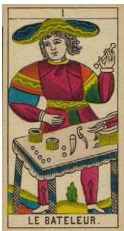
Arcano I – El Mago

El Mago, nos muestra a un hombre, sosteniendo una varita en la mano, y estando frente a una mesa llena de elementos, herramientas, implementos, etc.